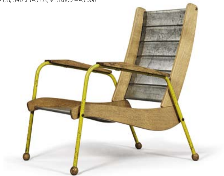
"Fauteuil Visiteur", Jean Prouvé, Francia 1942, tubo di ferro laccato giallo, lamina di zinco e quercia, altezza 94 cm, 70,5 x 85 cm, € 26.000 – 32.000