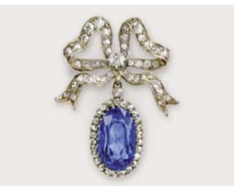
Pendente, periodo Jugendstil, oro 580, argento, diamanti, ca. 2,20 ct totali, zaffiro ca. 10 ct, catena in platino, punzoni austriaci 1867-1922, € 6.500 - 10.000