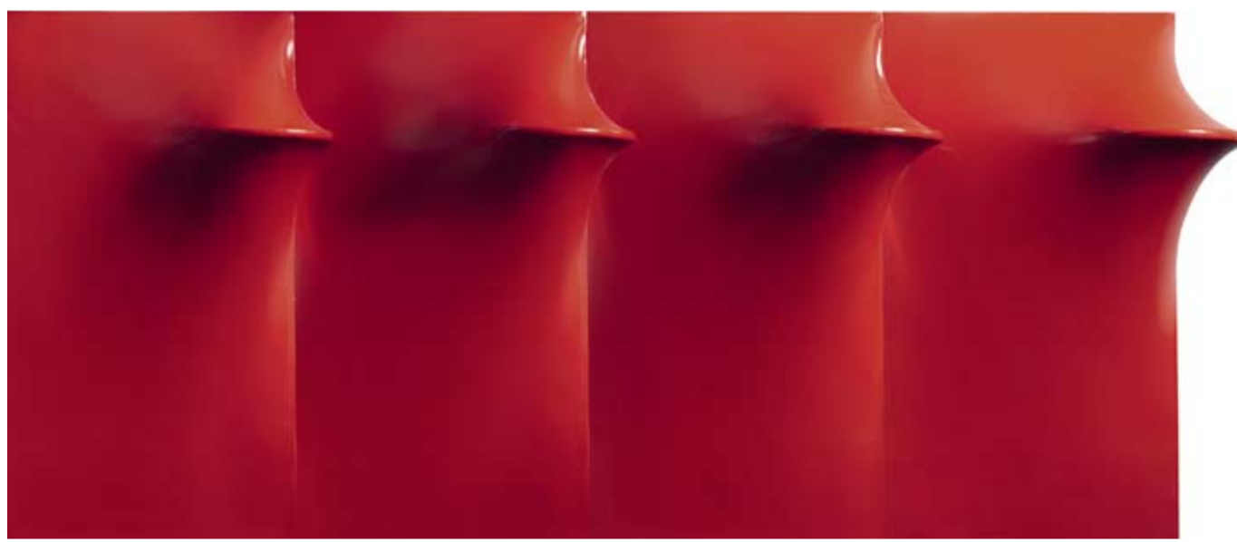
Agostino Bonalumi (nato 1935), Rosso, 1968, vetroresina e smalto, 75 x 168 cm, € 90.000 - 120.000