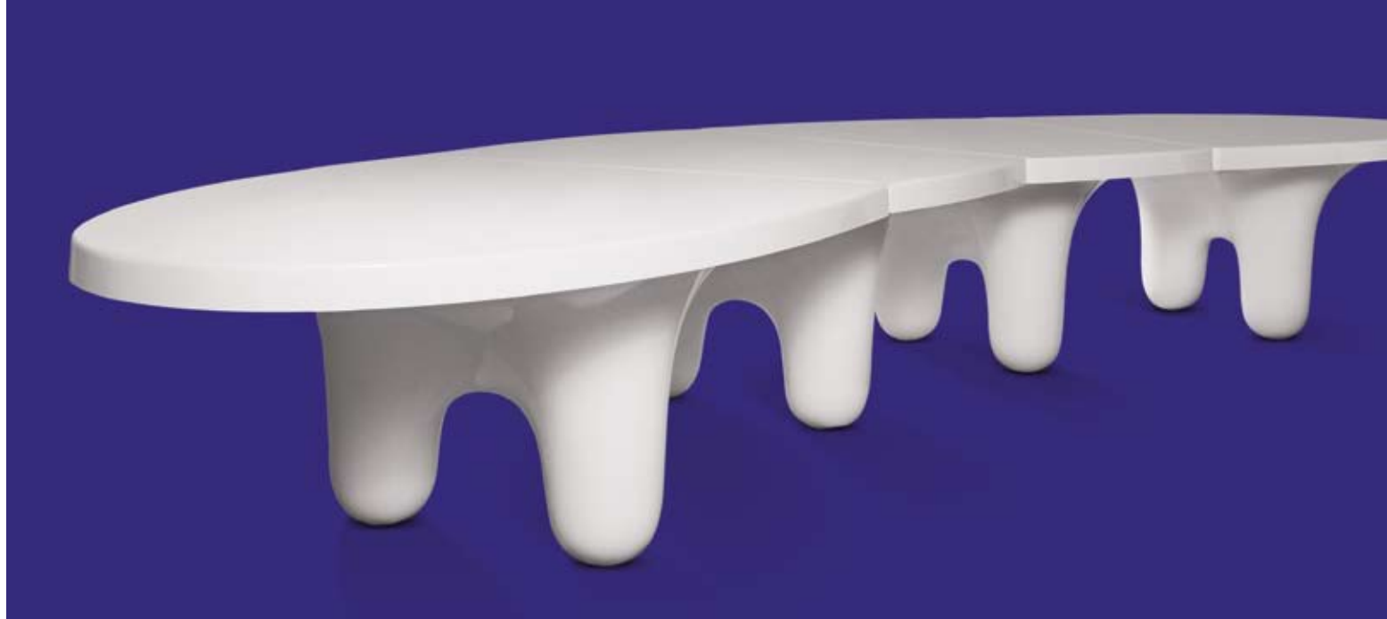
"The White Edition Big Table", Wendell Castle, ca. 1970, USA 2006, fibra di vetro, altezza 74 cm, 546 x 145 cm, € 38.000 – 45.000