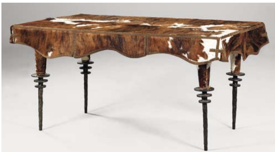
"Bureau Rodeo", Elizabeth Garouste & Mattia Bonetti, 1990, per Neotù/Parigi, ferro, quercia, pelo di puledro, cuoio, altezza 76,5 cm, 150 x 90 cm, € 40.000 – 45.000