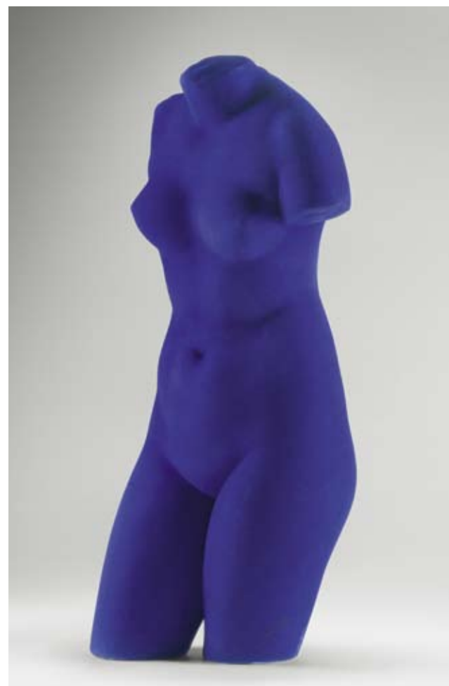
Yves Klein (1928-1962), Vénus bleue - La Vénus d'Alexandrie, pigmento IKB su gesso, altezza 70 cm, € 40.000 - 50.000