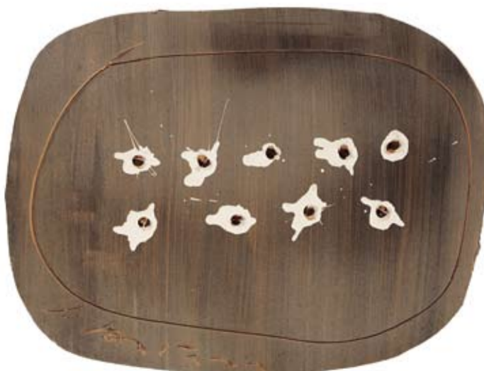
Lucio Fontana (1899–1968), Concetto spaziale , 1955–60, terracotta dipinta, 27 x 35,5 cm, € 50.000 – 70.000