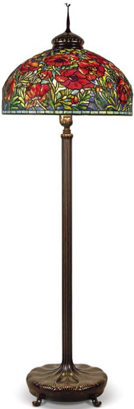
Lume da terra a sei fiamme "Oriental Poppy", progetto ca. 1900, realizzazione Tiffany Studios, New York, altezza 202 cm, € 60.000 – 100.000