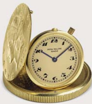
Orologio, Patek Philippe, United States of America Twenty Dollars, oro 750, Ø 35 mm, € 5.000 - 8.000