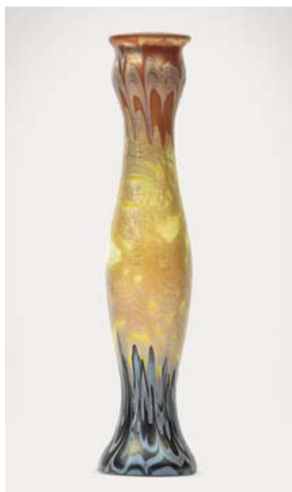
Franz Hofstötter (1871–1958), Vaso, progetto per l'esposizione mondiale del 1900 a Parigi, realizzazione vedova Löt, altezza 32,9 cm, € 11.000 – 14.000