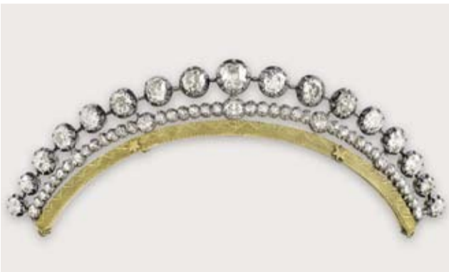
Fermacapelli, oro, argento, diamanti a taglio vecchio, ca. 22 ct totali, 1900 circa, € 22.000 - 30.000