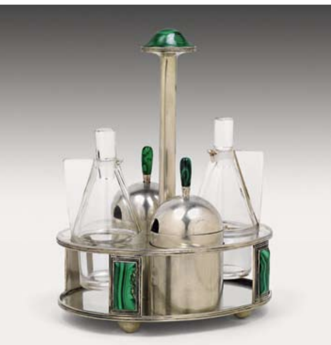
Josef Hoffmann (1870–1956), Oliera composta da 4 pezzi, progetto 1909, realizzazione Wiener Werkstätte, argento, malachite, vetro incolore, altezza 22,5 cm, € 30.000 – 40.000