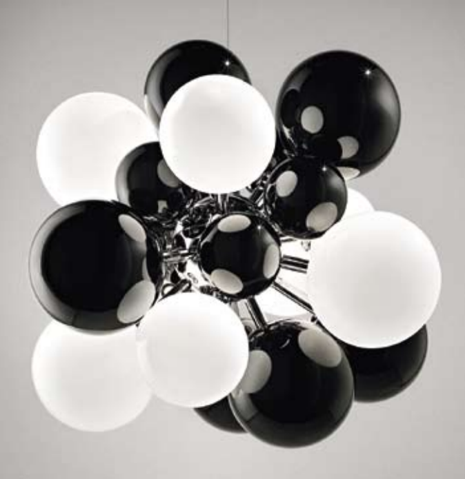
Grande lume "Digit", Emmanuel Babled, Italia 2008, vetro di Murano, Ø 130 cm, € 22.000 – 28.000