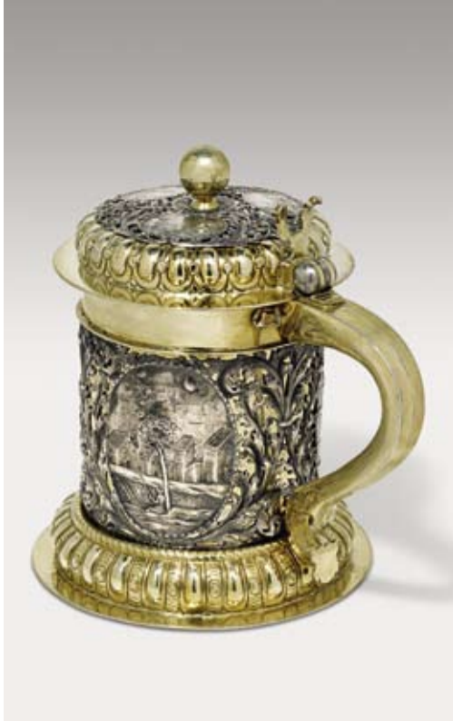
Boccale con coperchio, Lipzia, ca. 1690, argento in parte dorato, altezza 24 cm, € 16.000 – 20.000