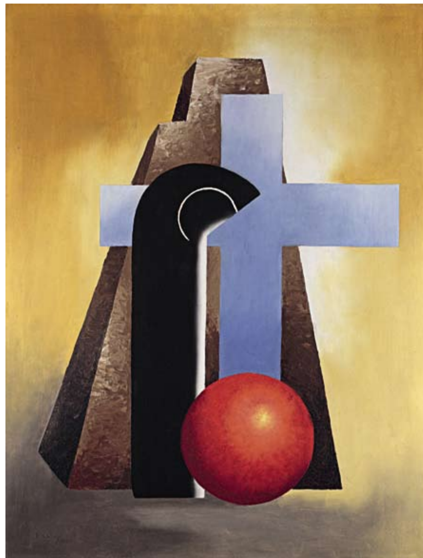
Fillia (1904–1936), L'Adorazione, 1931, tempera su cartone, 65 x 50 cm, € 28.000 – 35.000