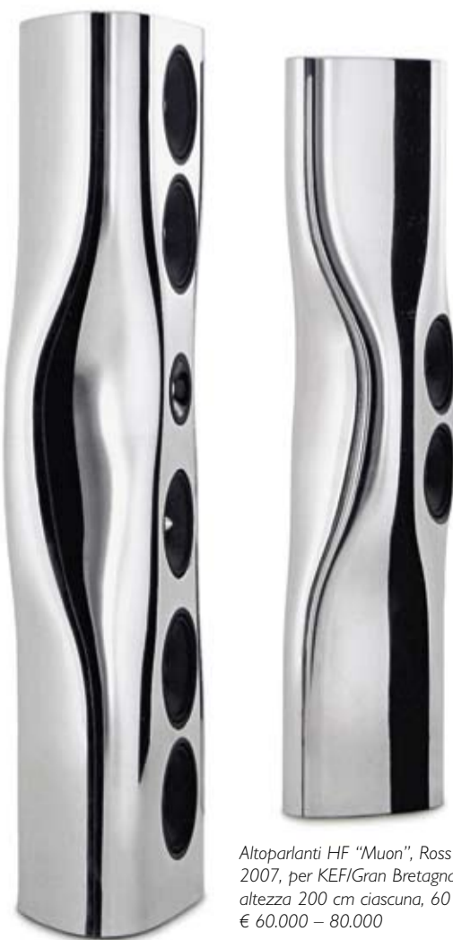
Altoparlanti HF "Muon", Ross Lovegrove, 2007, per KEF/Gran Bretagna, alluminio, altezza 200 cm ciascuna, 60 x 38 cm, € 60.000 – 80.000