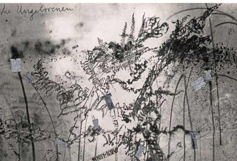
Anselm Kiefer (nato 1945), "die Ungeborenen", foto, collage con piombo e vetro, 60 x 94 cm, € 90.000 - 120.000