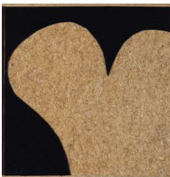
Alberto Burri (1915-1995), Cellotex, 1991, acrilico, Vinavil su cellotex, 19 x 18,5 cm, € 20.000 - 30.000