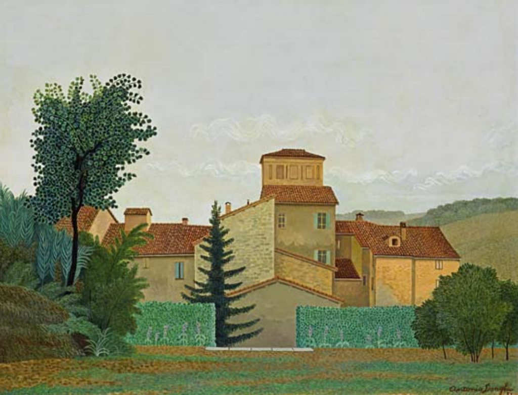
Antonio Donghi (1897–1963), Paesaggio no. 1, 1951, olio su legno, 40 x 50 cm, € 32.000 – 38.000