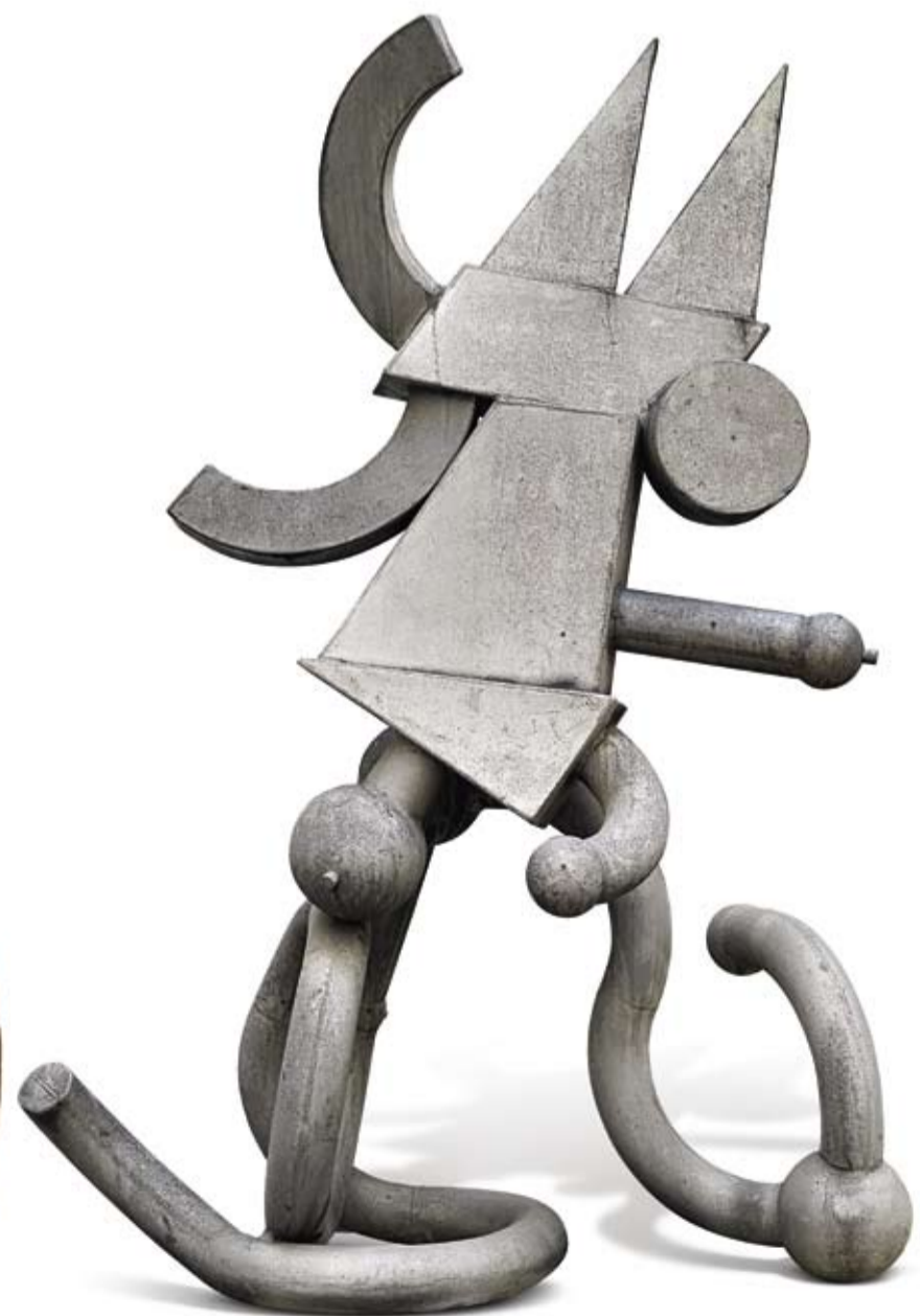
Eduardo Paolozzi (1924–2005), Parrot , 1964, alluminio, 205 x 147 x 82 cm, € 70.000 – 100.000