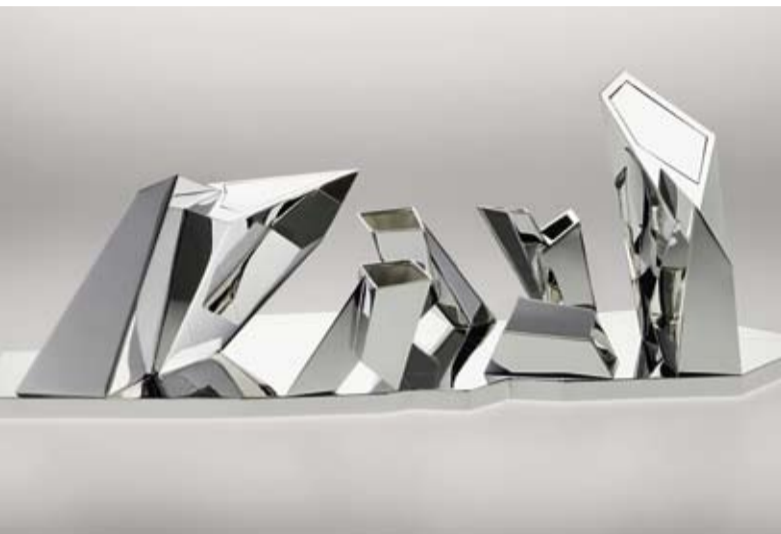
Servizio da tè e da caffè, Daniel Libeskind per Sawaya & Moroni, USA/Italia 2009, argento Sterling, 7 pezzi, € 70.000 – 80.000