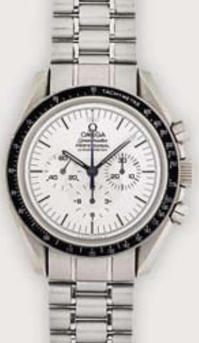
Omega Speedmaster Apollo XI 1969-94, n. 97/500, oro bianco 750, € 10.000 - 16.000