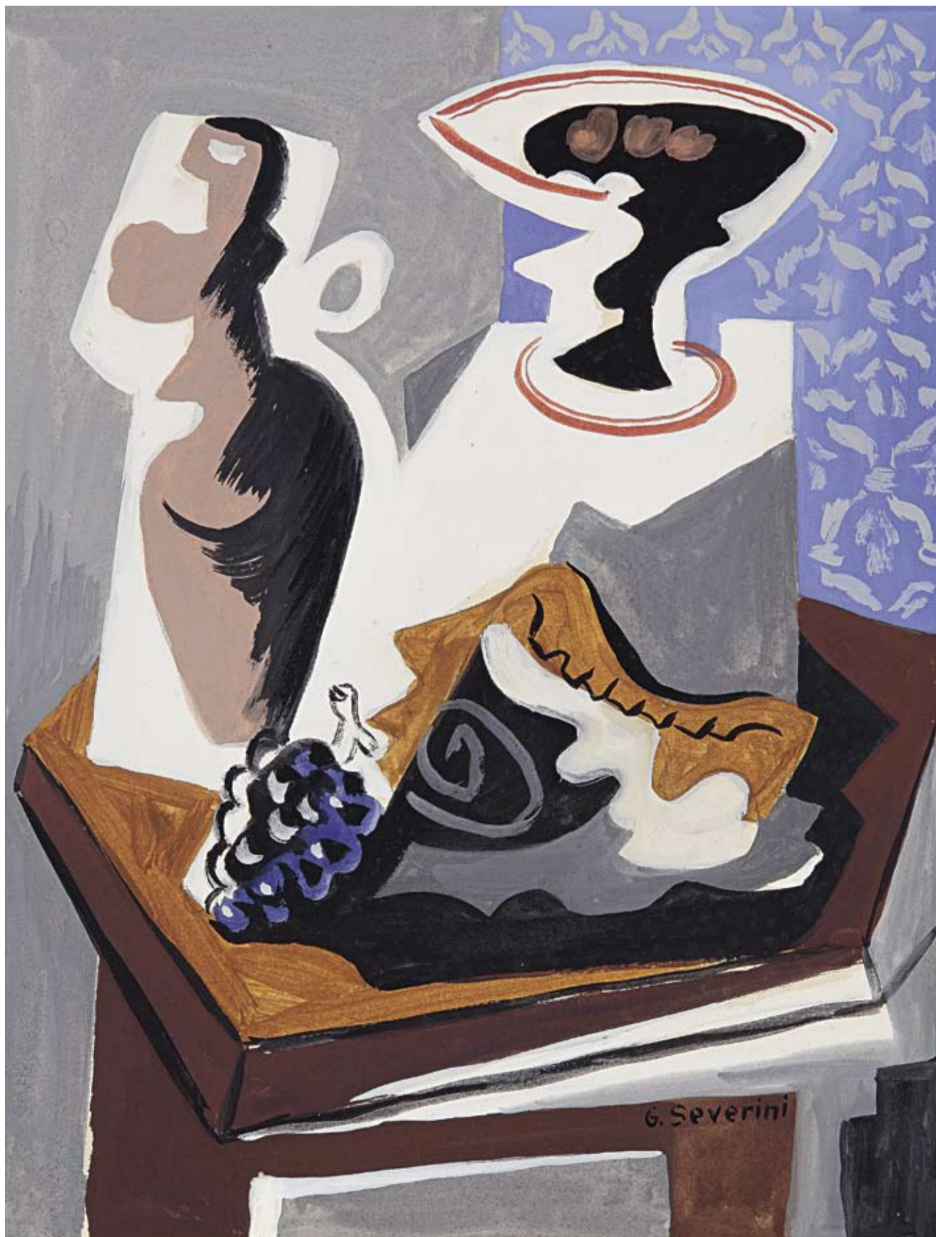
Gino Severini (1883–1966), Natura morta , ca. 1946, tempera su cartone sottile, 29 x 22,5 cm, € 25.000 – 35.000

Vienna , Elke Königseder, Patricia Pálffy, Monika Meindl, Eva Königseder tel. +43 1 515 60-358, -386, -370, -421, 20c.paintings@dorotheum.at Düsseldorf , Petra Schäpers tel. +49 211 210 77 47, petra.schaepers@dorotheum.de Milano , Alessandro Rizzi tel. +39 02 303 52 41, alessandro.rizzi@dorotheum.it Roma , Maria Cristina Corsini tel. +39 06 699 23 671, maria.corsini@dorotheum.it