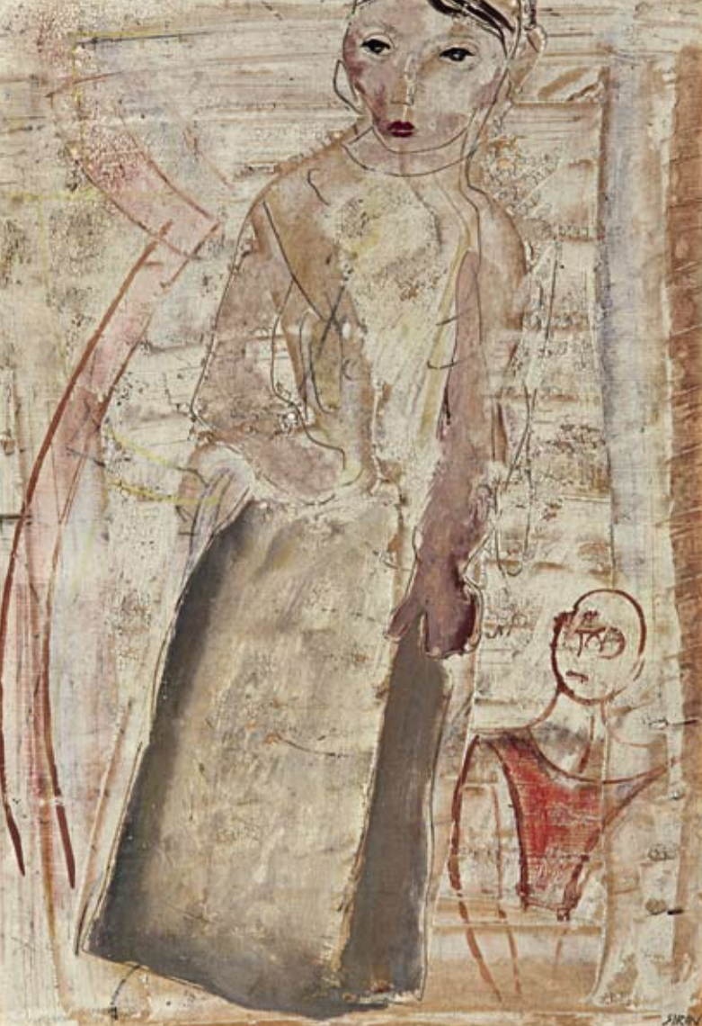
Mario Sironi (1885–1961), Figura femminile e manichino , ca. 1925, olio e matita su tela, 44 x 31 cm, € 35.000 – 45.000