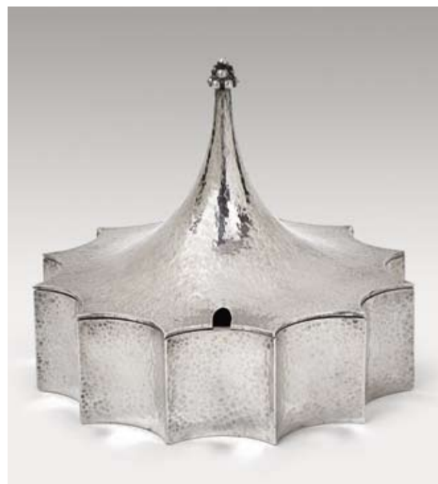
Josef Hoffmann (1870–1956), Zuccheriera, progetto 1904, realizzazione Wiener Werkstätte, argento martellato, altezza 12,5 cm, Ø 14,4 cm, € 30.000 – 50.000