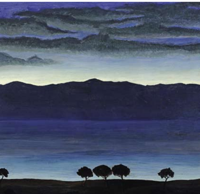
Luigi Russolo (1885–1947), Notturmo, 1945, olio su legno, 55 x 61 cm, € 20.000 – 30.000