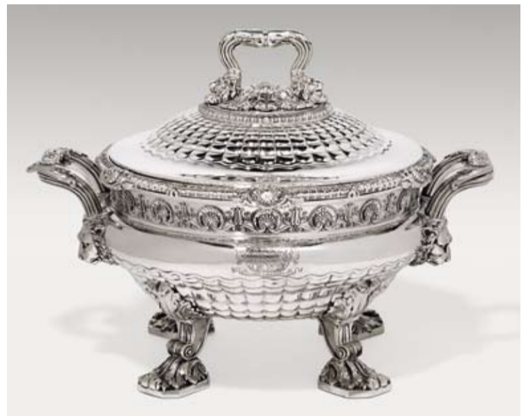
Paul Storr, terrina con coperchio Giorgio III, Londra, argento, altezza 29,5 cm, Ø 31 cm, € 25.000 – 35.000