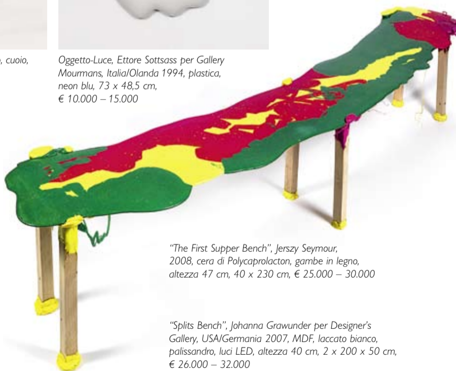
"The First Supper Bench", Jerszy Seymour, 2008, cera di Polycaprolacton, gambe in legno, altezza 47 cm, 40 x 230 cm, € 25.000 – 30.000