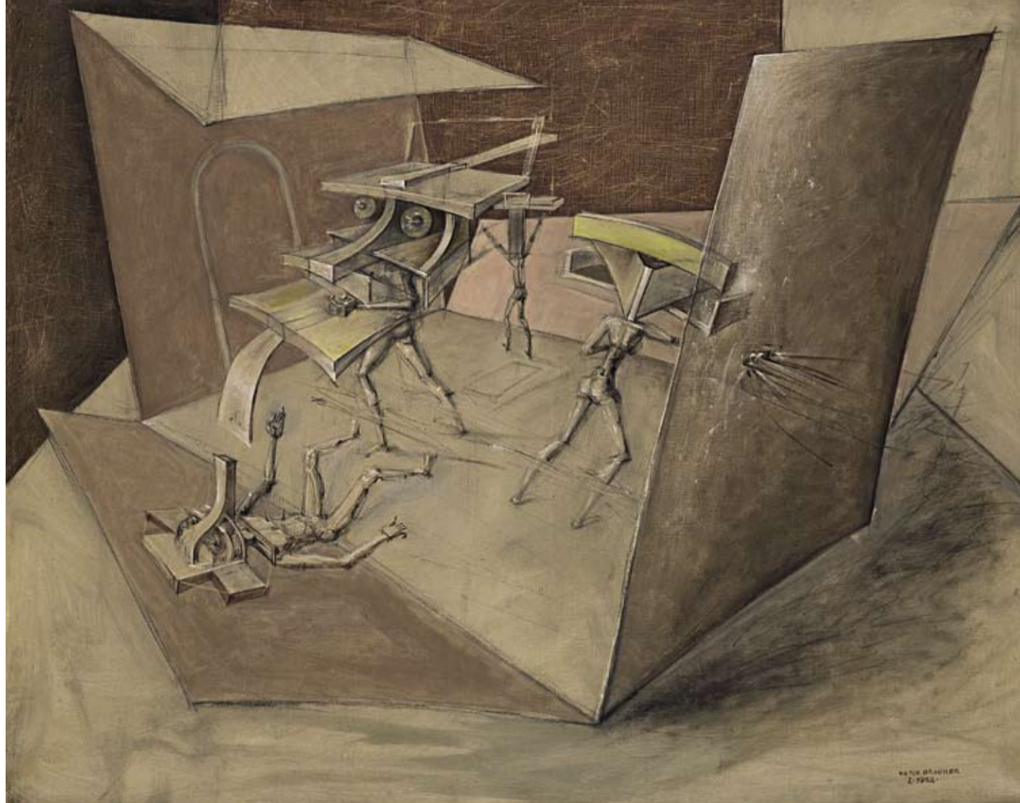
Victor Brauner (1903–1966), "Dépolarisation de l'intimité" , 1952, olio su tela, 73 x 92 cm, € 70.000 – 100.000