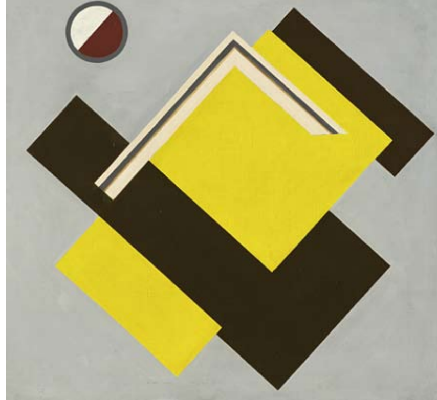
Mauro Reggiani (1897–1980), Composizione no. 1, 1939, olio su tela, 75 x 80 cm, € 25.000 – 30.000