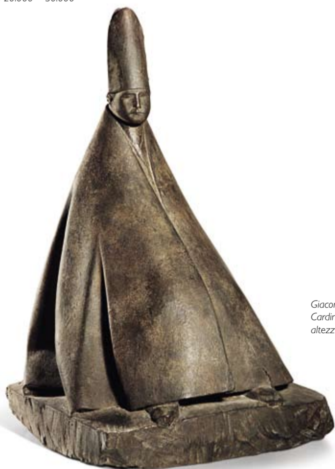
Giacomo Manzù (1908–1991), Cardinale seduto, 1960, bronzo, altezza 41 cm, € 50.000 – 70.000