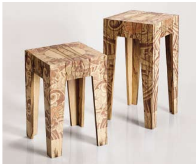
Tavoli d'appoggio "Yakuza", design Reddish, Israele 2006, MDF impiallacciato in legno, tatuaggi in stampa digitale, altezza 70 cm e 57 cm, 36 x 36 cm, € 6.800 – 7.500