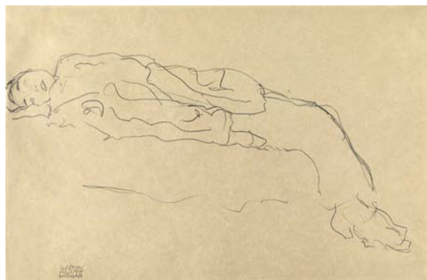
Gustav Klimt (1862–1918), Donna sdraiata sul sofà, matita su carta, 37,4 x 57 cm, € 35.000 – 50.000