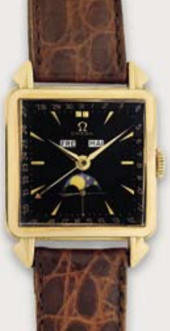
Omega Cosmic con calendario completo, oro, 1952 circa, € 10.000 - 16.000