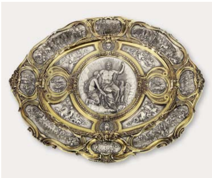
Piatto da parata con scene della guerra di Troia, Birmingham, 1850/51, argento in parte dorato, 62,5 x 47,5 cm, € 22.000 – 28.000