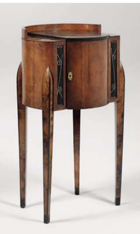
Chiffoniere, André Arbus, Francia, anni '30, impiallacciatura in palissandro e radica, cuoio, parti dorate, piano in marmo, altezza 110 cm, € 35.000 – 45.000