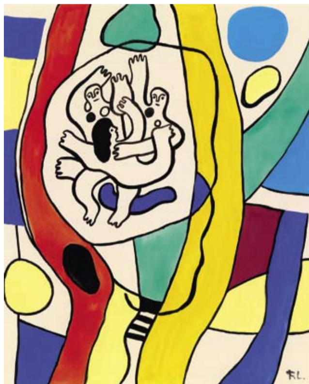
Fernand Léger (1881–1955), "Projet pour Sao Paulo" , ca. 1952, gouache, china su carta, 65 x 48,7 cm, € 30.000 – 40.000