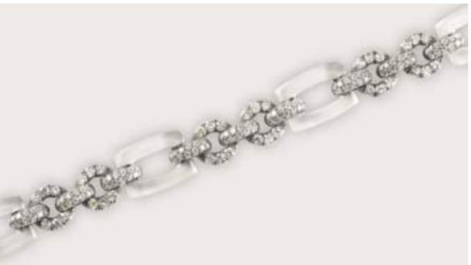
Bracciale in diamanti e cristalli di rocca, platino 950, oro bianco 585, brillanti e diamanti, ca. 7,70 ct totali, 1930 circa, € 8.000 - 12.000