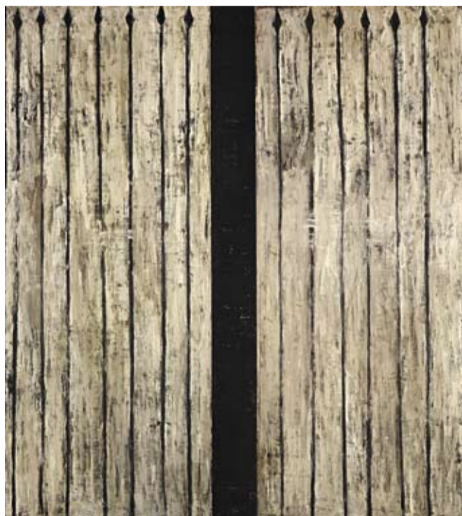
Piero Pizzi Cannella (nato 1955), Nero Ferro battuto , 1986–87, olio su tela e legno, 270 x 243 cm, € 25.000 – 35.000

Vienna , Elke Königseder, Patricia Pálffy, Monika Meindl, Eva Königseder tel. +43 1 515 60-358, -386, -370, -421 20c.paintings@dorotheum.at Düsseldorf , Petra Schäpers tel. +49 211 210 77 47 petra.schaepers@dorotheum.de Milano , Alessandro Rizzi tel. +39 02 303 52 41 alessandro.rizzi@dorotheum.it Roma , Maria Cristina Corsini tel. +39 06 699 23 671 maria.corsini@dorotheum.it