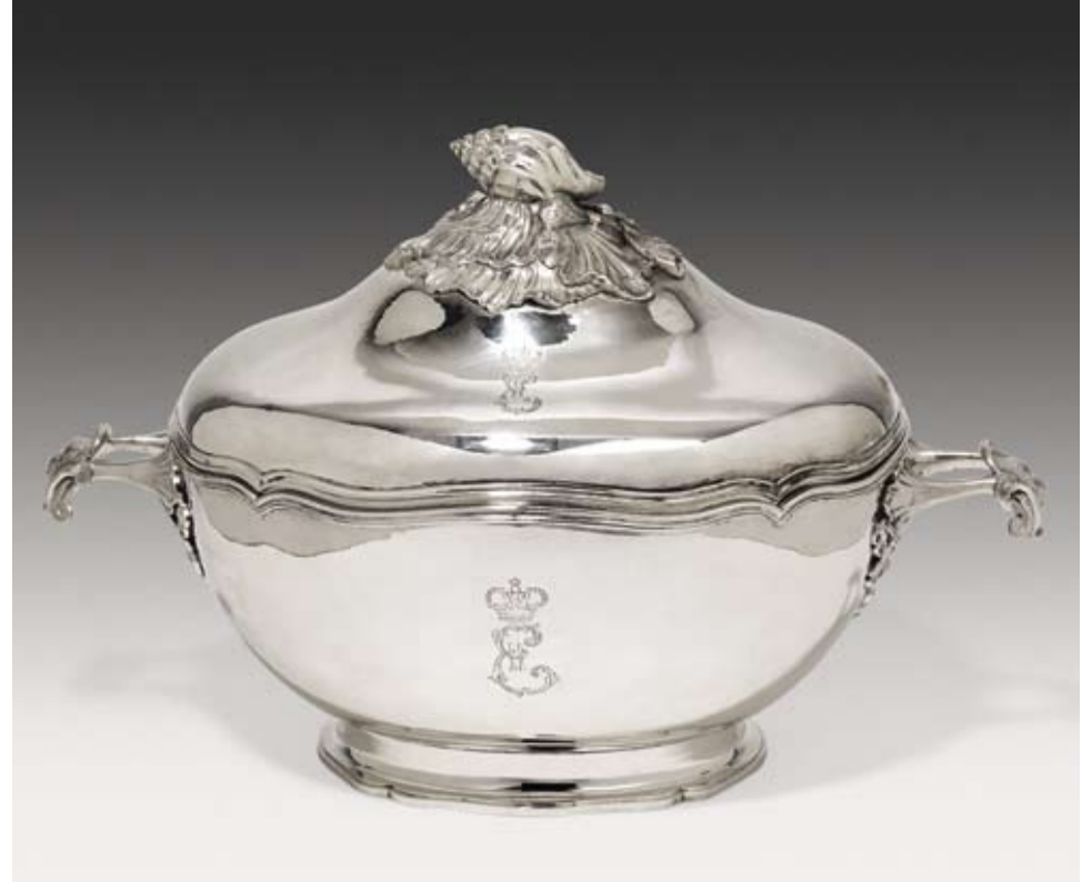
Terrina con coperchio della Zarina Caterina II La Grande, San Pietroburgo, 1768, argento, interno dorato, altezza 28 cm, € 30.000 – 40.000