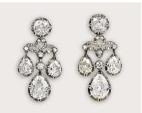
Orecchini pendenti, oro/argento, brillanti e diamanti a taglio vecchio, ca. 14 ct totali, montatura in argento, XIX secolo, € 30.000 - 40.000