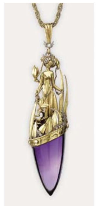
Alfred Benninghoven, pendente con catena, Idar-Oberstein 1921, oro giallo 750, platino, ametista, peridot e diamanti, 7,5 cm, € 15.000 – 20.000