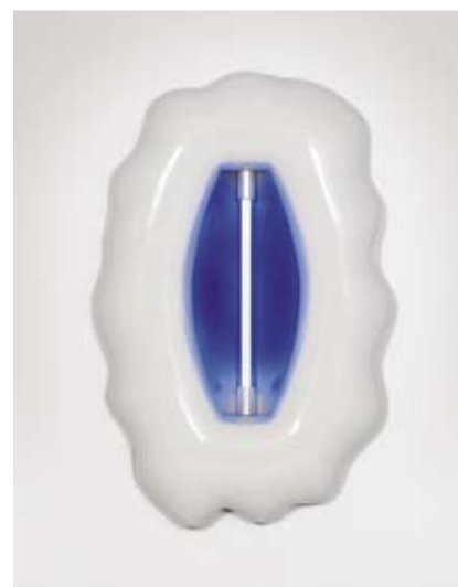
Oggetto-Luce, Ettore Sottsass per Gallery Mourmans, Italia/Olanda 1994, plastica, neon blu, 73 x 48,5 cm, € 10.000 – 15.000