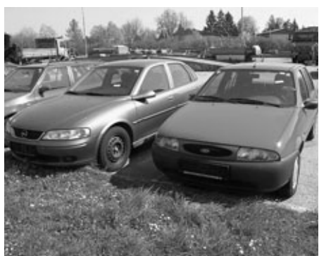
75 + 76