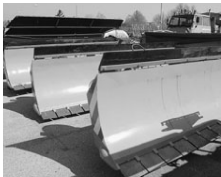
67 + 65 + 66