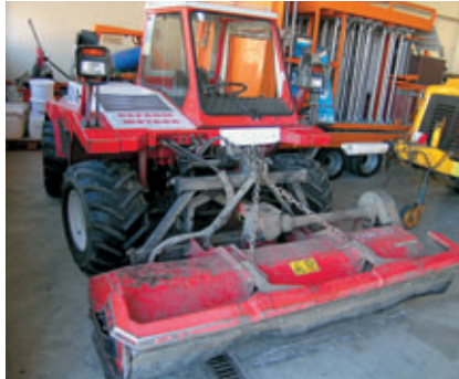
24 + 31