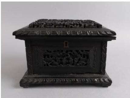
Ebenholz, geschnitzt, unter dem Deckel herausnehmbare Lade, Höhe 12,5 cm, 18 x 14,5 cm, Schloss, Schlüssel fehlt, Scharnier beschädigt