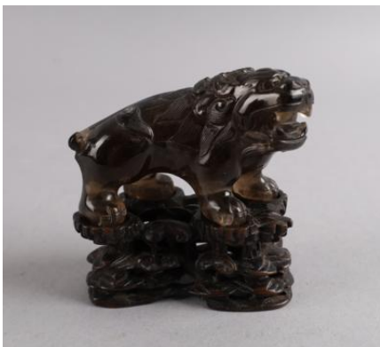
China, Anf. 20. Jh., Rauchquarz, geschnitzt, Höhe 5 cm, Länge 8 cm, auf geschnitztem Holzsockel