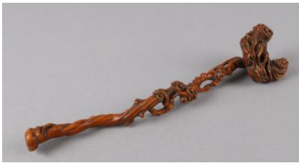
Wurzelholz, Länge 24 cm