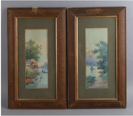
Zwei Aquarelle, a) "Fischer auf einem Boot", b) "Segelschiffe auf einem See vor bergigem Hintergrund", signiert, Künstlersiegel, je 28,3 x 10,6 cm, Passep., gerahmt,