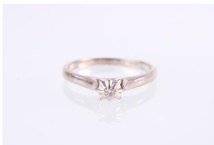
Weißgold 585, RW 53, 2,2 gøg2