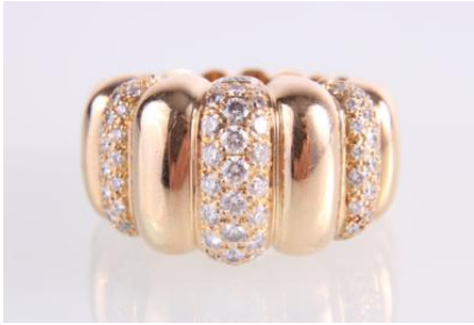
Gold 750, RW 55, 15 g øG15