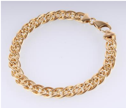
Gold 585, Länge ca. 20 cm, 11,5 gøg12