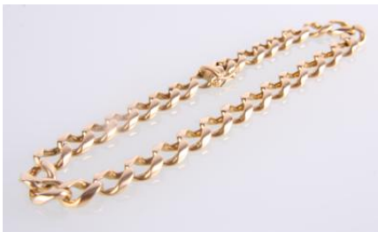
Gold 750, Länge ca. 20,5 cm, Steckschließe, Sicherheitsachter, 17,3 g, stark gebrauchtøg17