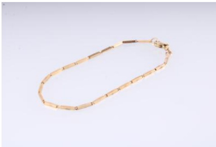
Gold 585, Länge ca. 18 cm, 3,7 gøg4