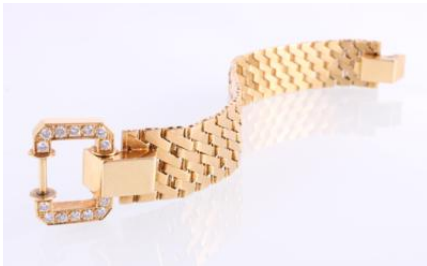
Gold 750, tlw. mattiert, Länge ca. 18 cm, Faltschließe, 55,6 gøg56