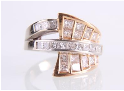
Gold/Weißgold 750, RW 52, 11 g