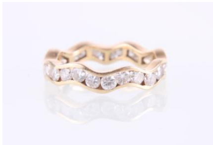
Gold 585, RW 50, 2,2 gøg2

Auktionstermin: 05.06.2024, 10:00 Auktionstyp: Online Auction Meistbot exkl. Käufergebühr und Mehrwertsteuer