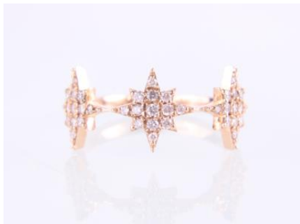
Gold 585, RW 55, 2,2 gøg2