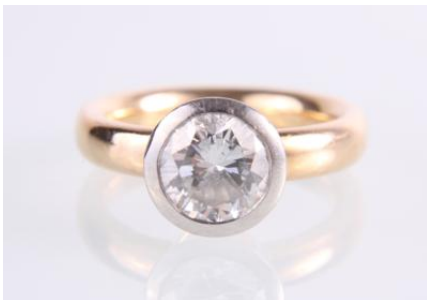
Gold 750/platin 950, RW 52, 8,8 g øG8