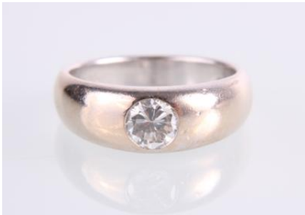
Weißgold 750, RW 51, 7 g øG7 Brillant gekerbt