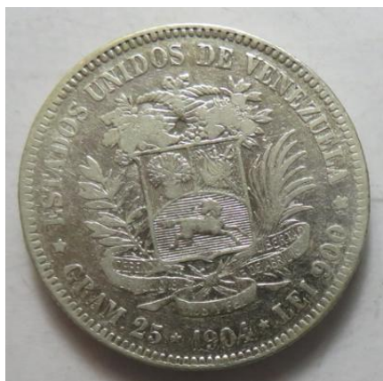
5 Bolivares 1904, =24,74 g= III-