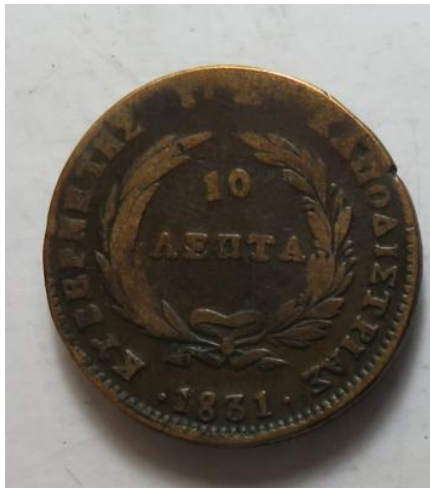
10 Lepta 1831, =13,20 g= IV/III