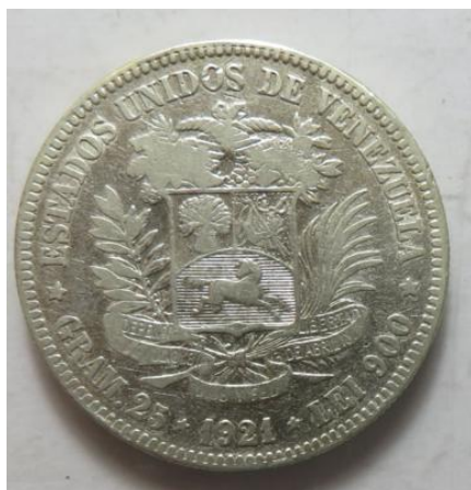
5 Bolivares 1921, =24,76 g= III-