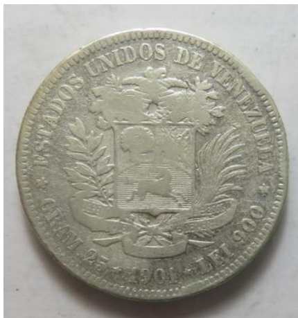
5 Bolivares 1901, =24,22 g= IV