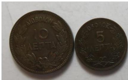
5 und 10 Lepta 1878, =4,94 g, 9,65 g= III/III+