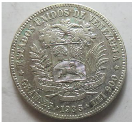
5 Bolivares 1935, =24,75 g= III