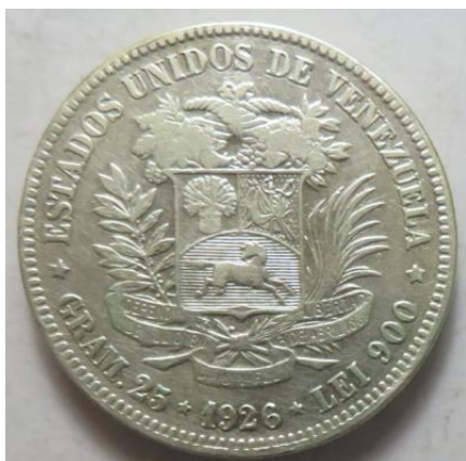
5 Bolivares 1926, =24,74 g= III-/III