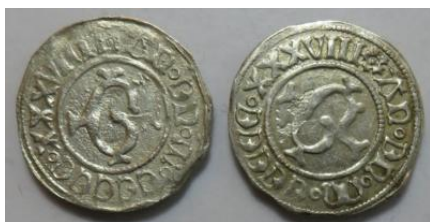
Körtling 1538. Saurma 3917; (gereinigt, Schrötlingsdefekt, Prägeschwächen) III- bis IV