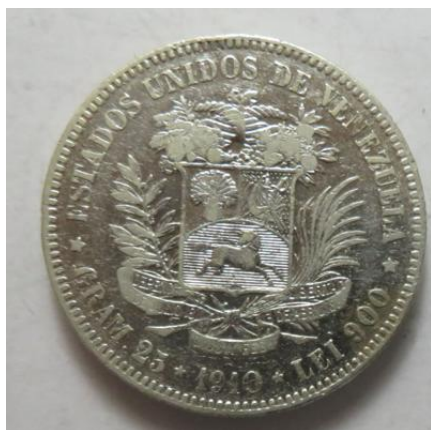
5 Bolivares 1910, =24,83 g= III-