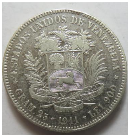
5 Bolivares 1911, =24,82 g= III-/III