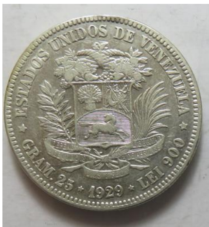
5 Bolivares 1929, =24,88 g= III