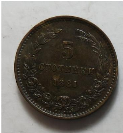
5 Stotinki 1881 Heaton, =5,08 g= III+