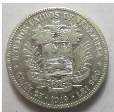
5 Bolivares 1919, =24,73 g= III-