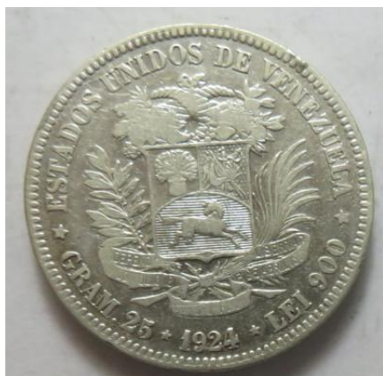
5 Bolivares 1924, =24,81 g= III-/III