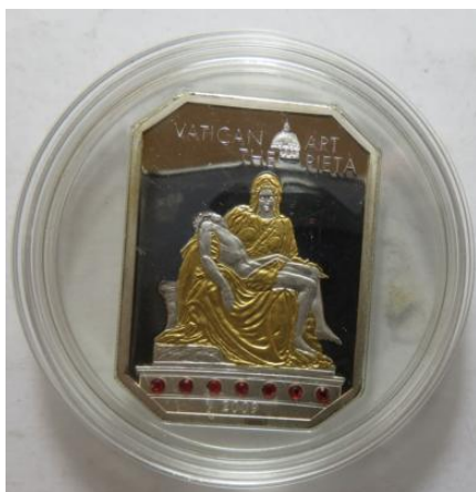
5 Dollars 2009 "Pietas", =25,25 g= PP