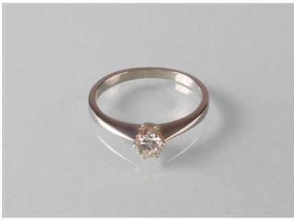
Weißgold 585, RW 52,5, 2,1 gøg2