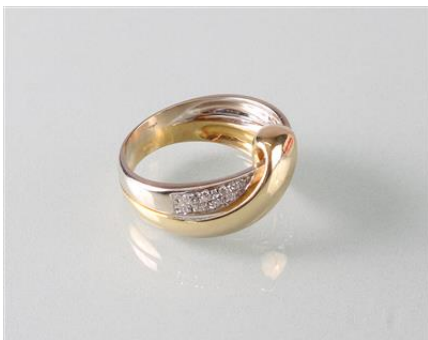
Gold und Weißgold 750, RW 57,5, 9,2 g Ringweitenänderungøg9