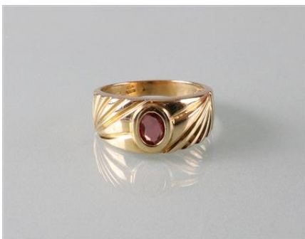
Gold 750, Rubellit, RW 52,5, 5,8 gøg6