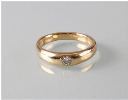
Gold 750, RW 59, 7,8 gøg8